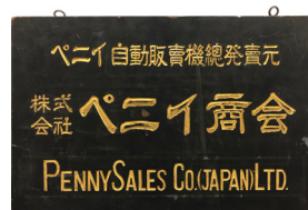
株式会社ペニイ商会の社名看板